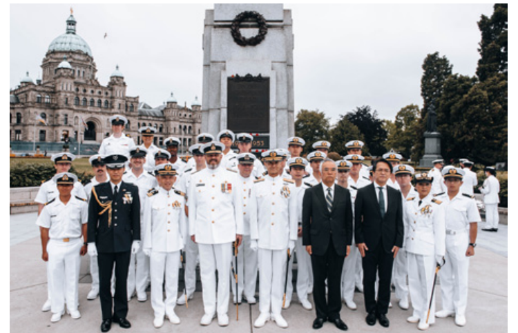
Les marins canadiens et japonais participent à une cérémonie de dépôt de couronnes à laquelle participe le contre-amiral Christopher Robinson, commandant des Forces maritimes du Pacifique, le 16 juin, afin de commémorer les militaires des conflits passés qui ont fait le sacrifice ultime.