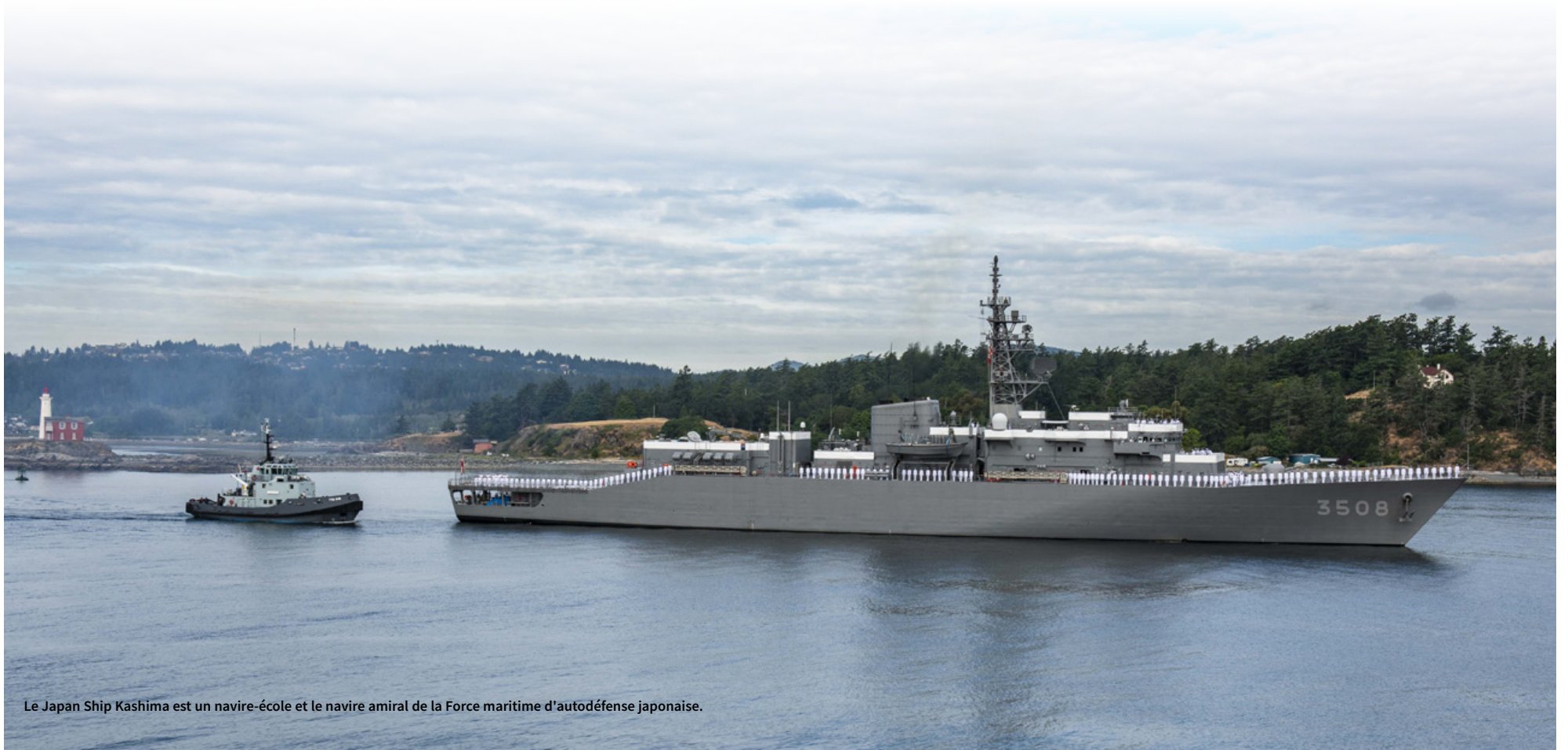
Le Japan Ship Kashima est un navire-école et le navire amiral de la Force maritime d'autodéfense japonaise.