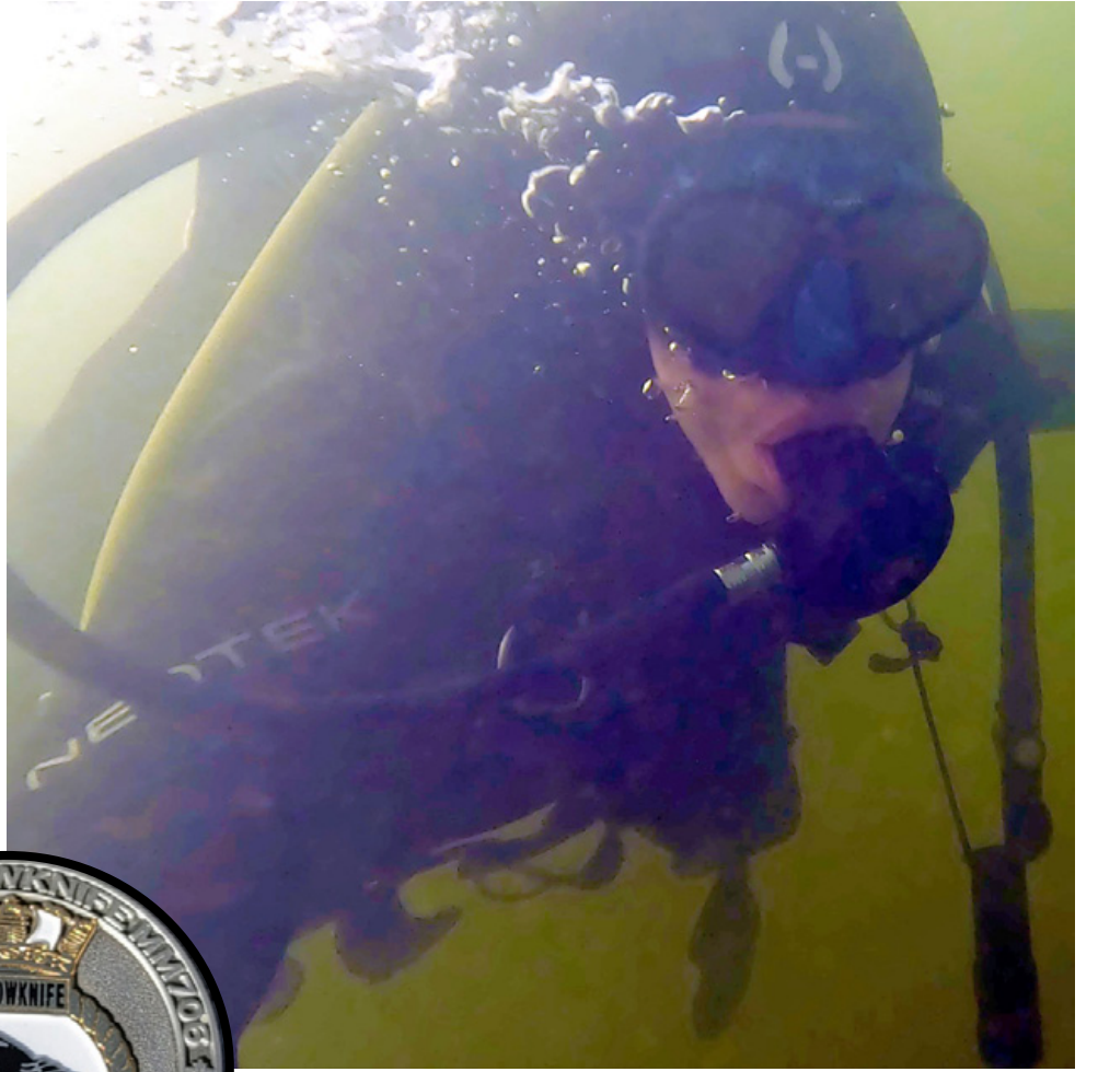
La visibilité dans le Grand lac des Esclaves ne permet de voir qu'à deux mètres devant soi.