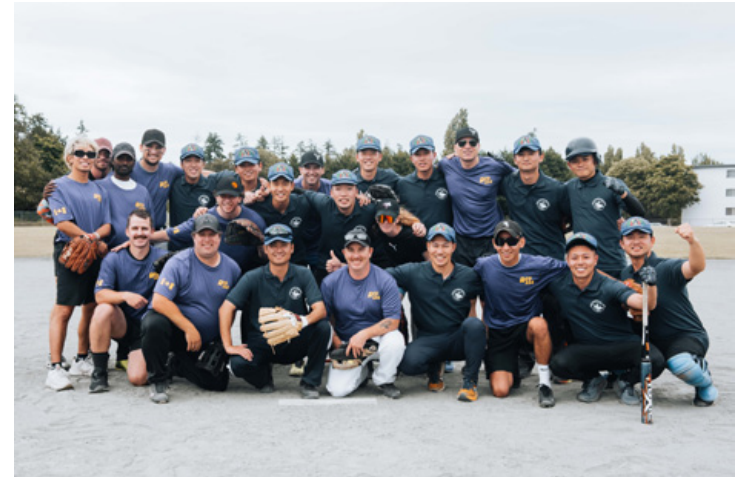
Le NCSM Regina était le navire hôte officiel de la Force maritime d'autodéfense du Japon et certaines de leurs activités comprenaient un dîner au mess du chef et des officiers maritimes et des compétitions de softball et de volleyball entre les navires sur les terrains de sport de Colville Road.