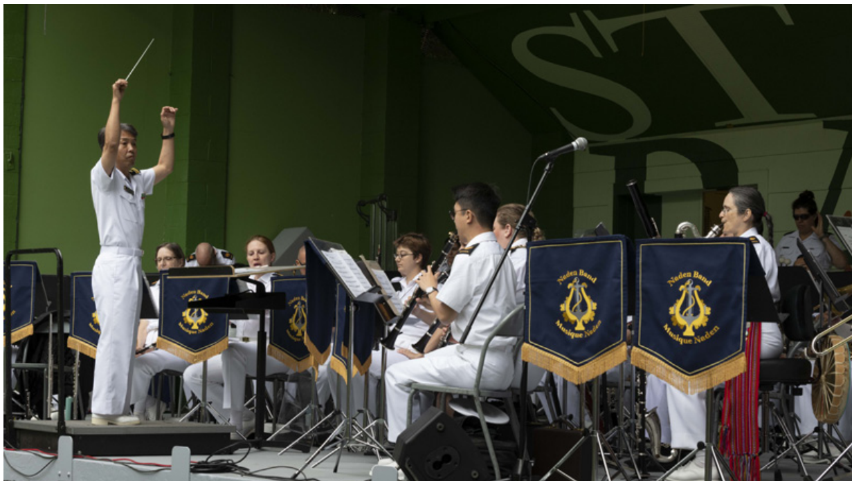
La fanfare Naden a interprété l'hymne national japonais Kimigayo et la fanfare de l'escadron d'entraînement japonais a joué O Canada, tandis que chaque fanfare a également interprété les chants de marche officiels de la marine de son pays. Le lendemain après-midi, les deux fanfares ont également participé à un concert commun au parc Beacon Hill.