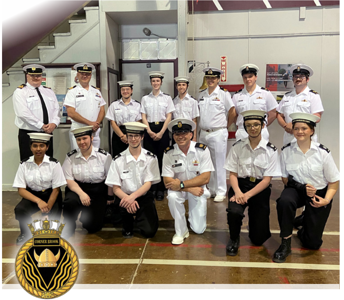
Les sous-marins du NCSM Corner Brook ont eu le plaisir de rencontrer les cadets du 182 Curling du Corps des cadets de la Marine royale du Canada dans le cadre de la visite de la ville éponyme de l'équipage. Plus tôt dans la journée, l'équipage et les cadets ont fait ensemble une randonnée de 5 km autour de l'étang Glynmill.

La visite s'est terminée à la Légion locale, où l'équipage a rendu hommage aux citoyens locaux pour leur soutien à l'unité en présence de l'honorable Gudie Hutchings, députée locale et ministre du Développement économique rural, et de l'honorable Gerry Byrne, membre de la Chambre d'assemblée et ministre de l'Immigration, de la Croissance démographique et des Compétences.