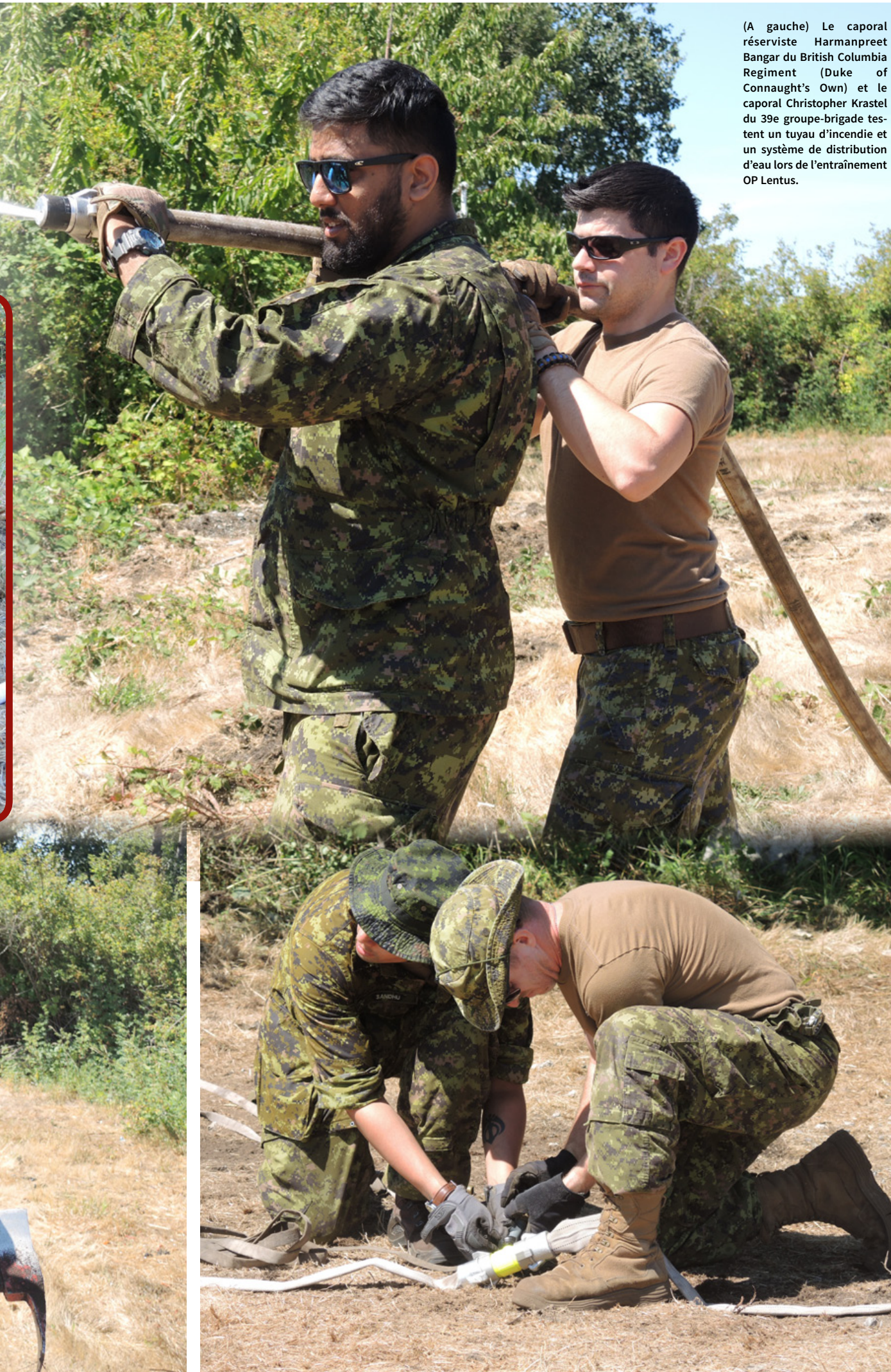
Les réservistes du 39e groupe-brigade canadien installent des lignes de distribution et des tuyaux.