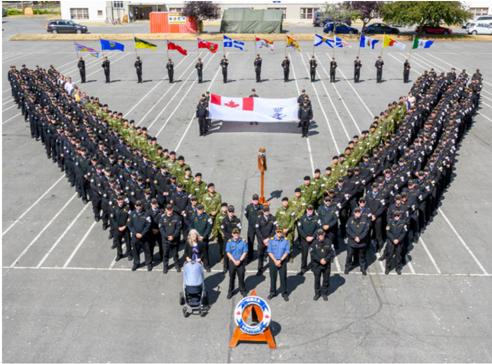
Plus de 300 membres du personnel et étudiants du NCSM Venture (et le nouveau bébé du commandant en second) se sont joints sur la place d'armes lors de la cérémonie de passation de commandement tenue à la BFC Esquimalt (Work Point) le 26 août.