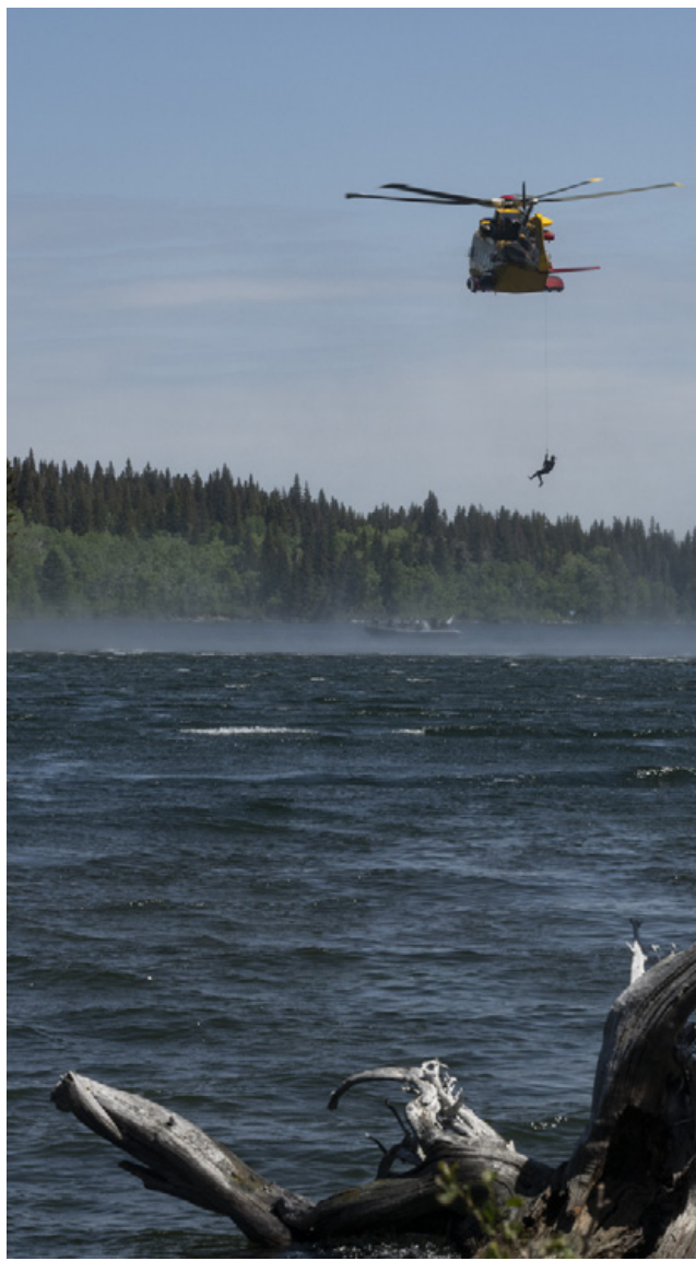
Un technicien en recherche et sauvetage du 442e Escadron de transport et de sauvetage descend dans l'eau pour sauver une victime simulée dans le cadre de leur participation à CHINTHEX 2023.

Les opérations telles que CHINTHEX23 permettent à la Marine d'améliorer son interopérabilité avec l'ARC, ce qui est un facteur essentiel pour répondre efficacement aux urgences et aux crises. Les partenariats formés au cours de CHINTHEX23 continueront de se renforcer, ce qui permettra aux FAC de répondre rapidement à toute situation nécessitant des opérations de recherche et de sauvetage.