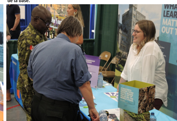
Un membre de l'université Royal Roads discute des cours disponibles avec deux membres des Forces armées canadiennes.