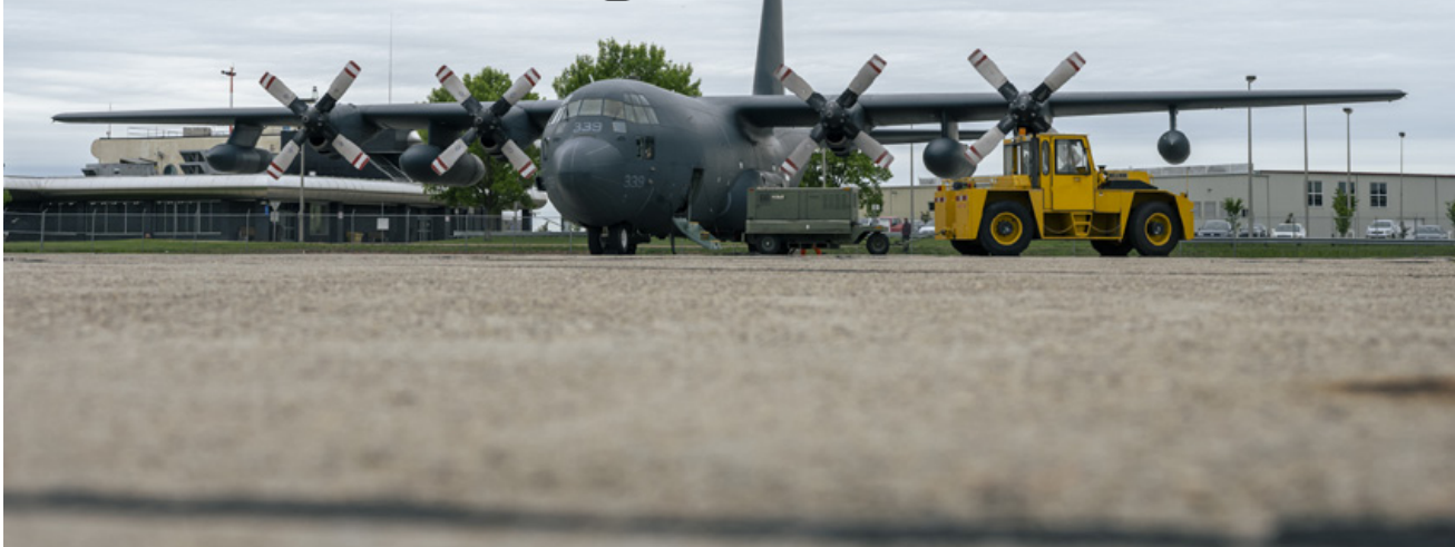
Un CC-130H des Forces canadiennes se trouve sur le tarmac et se prépare à décoller pour participer à CHINTHEX 2023, un exercice d'entraînement multi-unités de recherche et de sauvetage à Beaver Mines Lake (Alberta), le 6 juin.