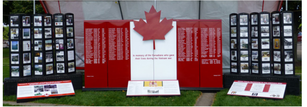
“La longue portée : Le rôle de la Marine royale canadienne dans la guerre de Corée” est actuellement présentée au musée et mémorial du NCSM Alberni.