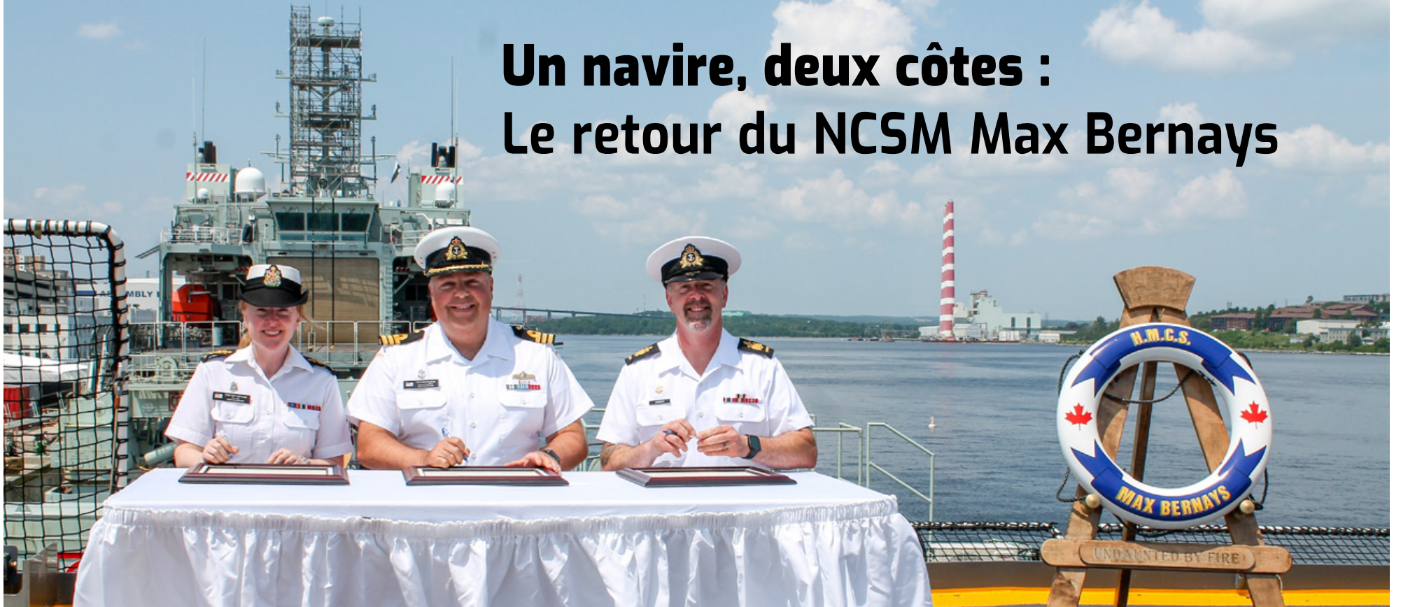
Cérémonie de changement de nomination du capitaine d'armes du NCSM Max Bernays, le 7 juillet, à Halifax (N.-É.).