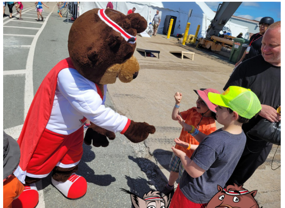
Peri rencontre des enfants lors de l'événement familial d'Halifax le 24 juin.