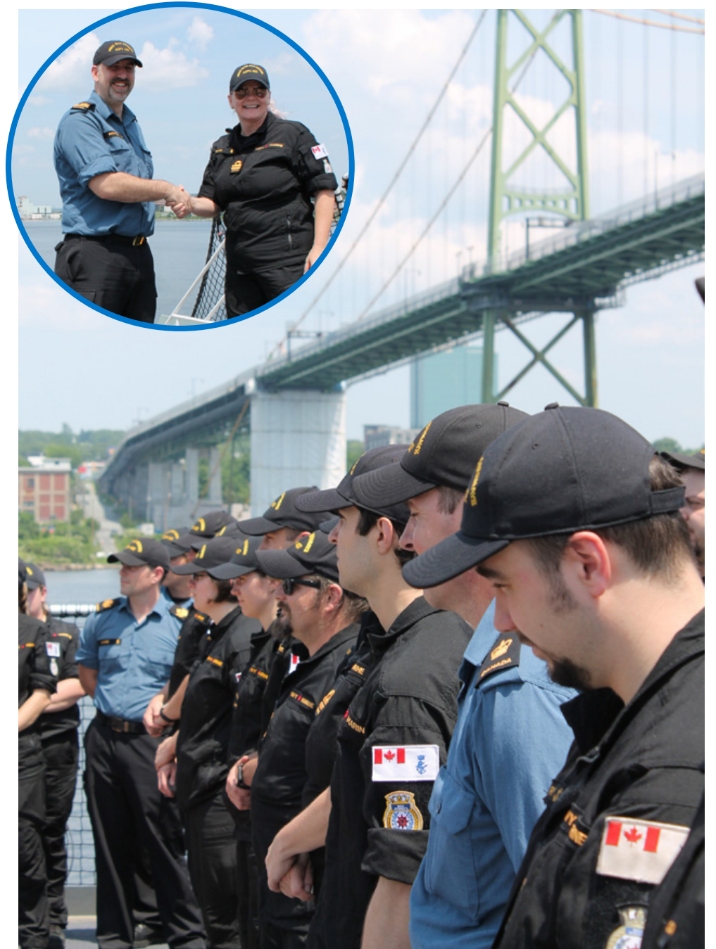
À droite : L'équipage du NCSM Max Bernays.

"Je m'efforcerai d'être ouvert, juste et honnête avec l'équipage afin de créer un environnement dans lequel chacun se sente valorisé et puisse contribuer à la mise à disposition d'une nouvelle capacité pour la côte ouest", a-t-il ajouté.