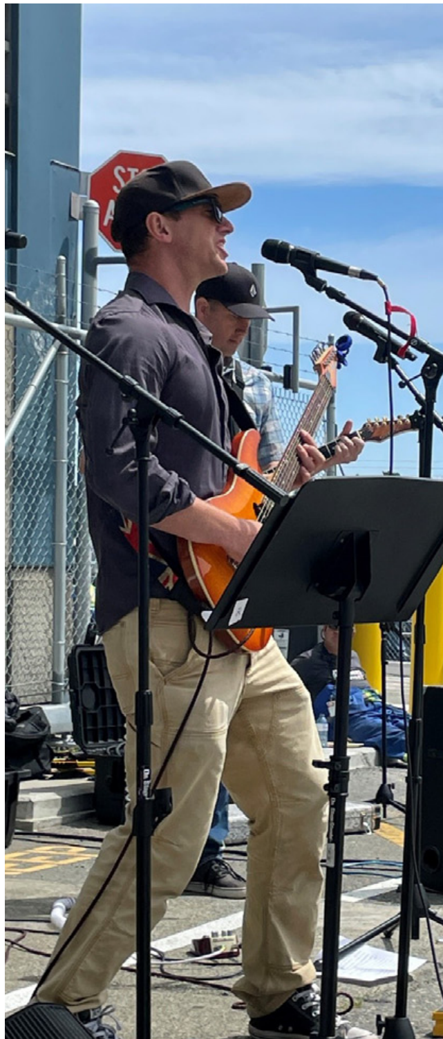
Le groupe s'est également produit lors de la soirée pizza de la Semaine nationale de la fonction publique de la FMFCB en juin.