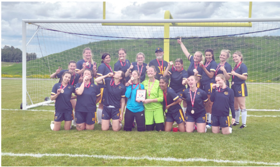
The Esquimalt Tritons women's and men's soccer teams won the Canada West regional qualifying tournaments in Edmonton, Alta.