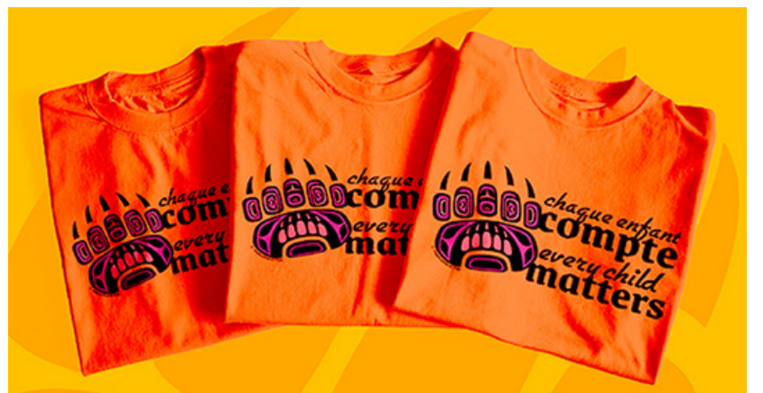
Achetez votre t-shirt orange chez CANEX jusqu'à épuisement des stocks !