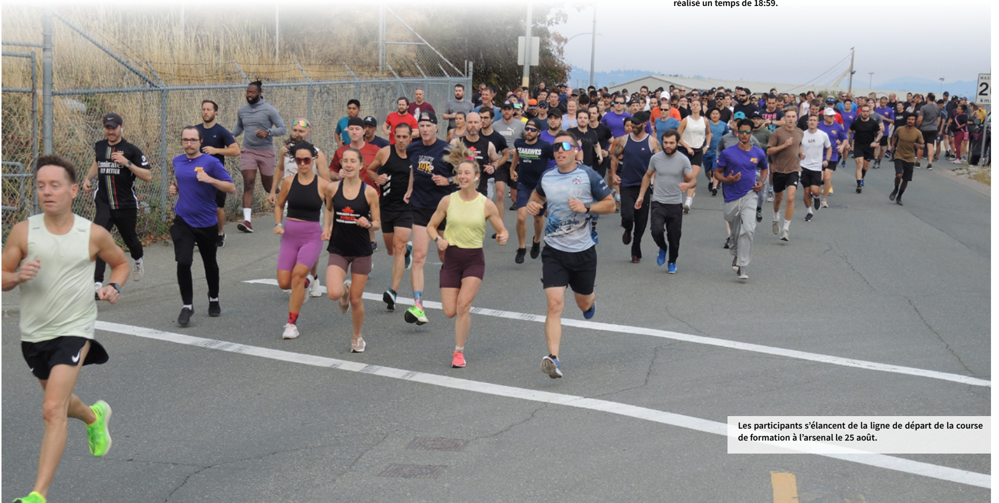
Les participants s'élancent de la ligne de départ de la course de formation à l'arsenal le 25 août.