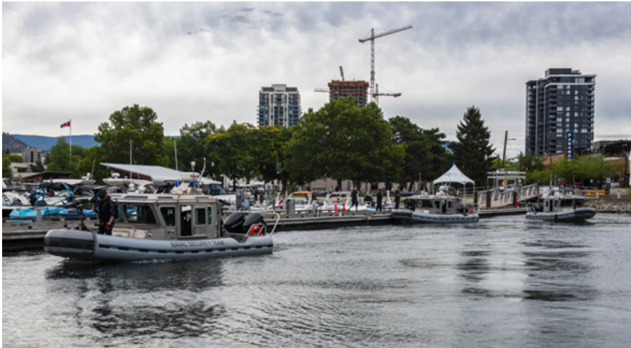
Des membres de l'équipe de sécurité navale (ESN) mettent à l'eau des embarcations de sécurité navale Defender à la marina de Kelowna, en Colombie-Britannique, le 25 juillet.

La réponse des villes et des maires a été : “Nous avons hâte que vous reveniez. C'est fantastique”, a-t-il déclaré.