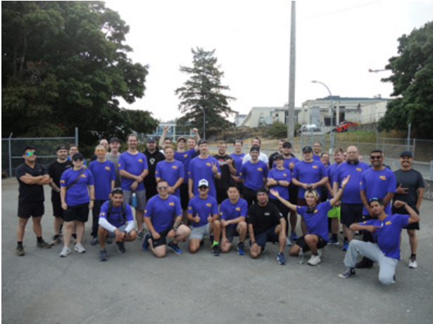
Les membres du NCSM Regina se rassemblent pour une photo de groupe avant le départ de la course de formation à l'arsenal le 25 août.

La prochaine course de formation est prévue pour le 29 septembre et les coureurs porteront des t-shirts orange pour commémorer la Journée de la vérité et de la réconciliation.