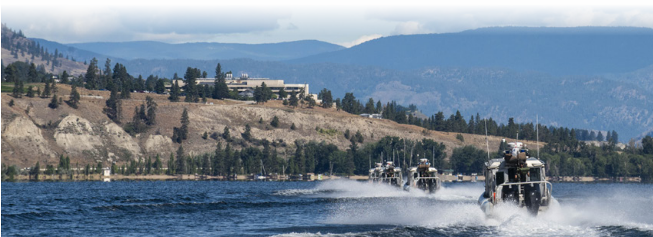
Les membres de l'ESN s'entraînent près de Summerland, C.-B., le 26 juillet.