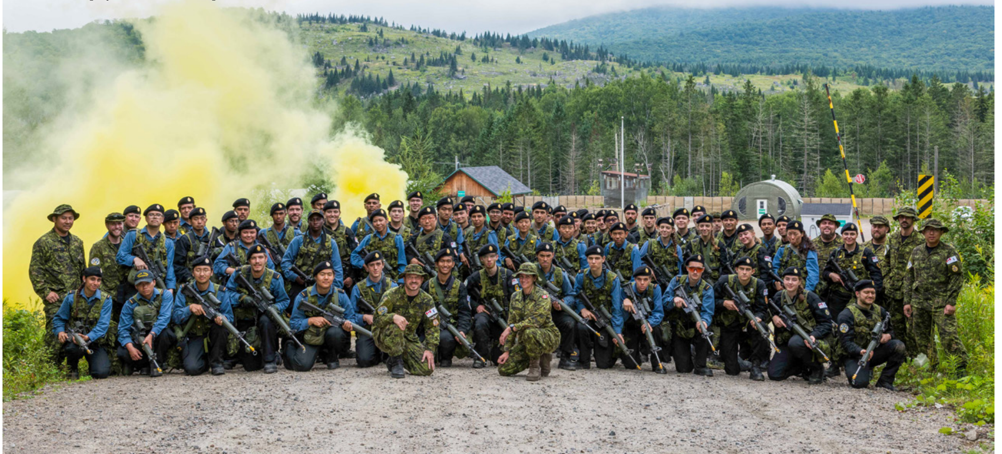
Des étudiants du QMB prennent une photo de groupe devant la base d'opérations navales avancée de la BFC Valcartier, le 17 août.