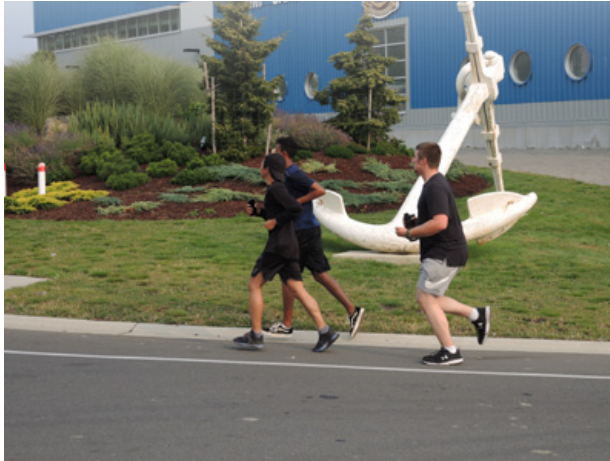
Les coureurs passent devant l'installation de maintenance de la flotte (IMF) Cape Breton pendant la Course de formation le 25 août.