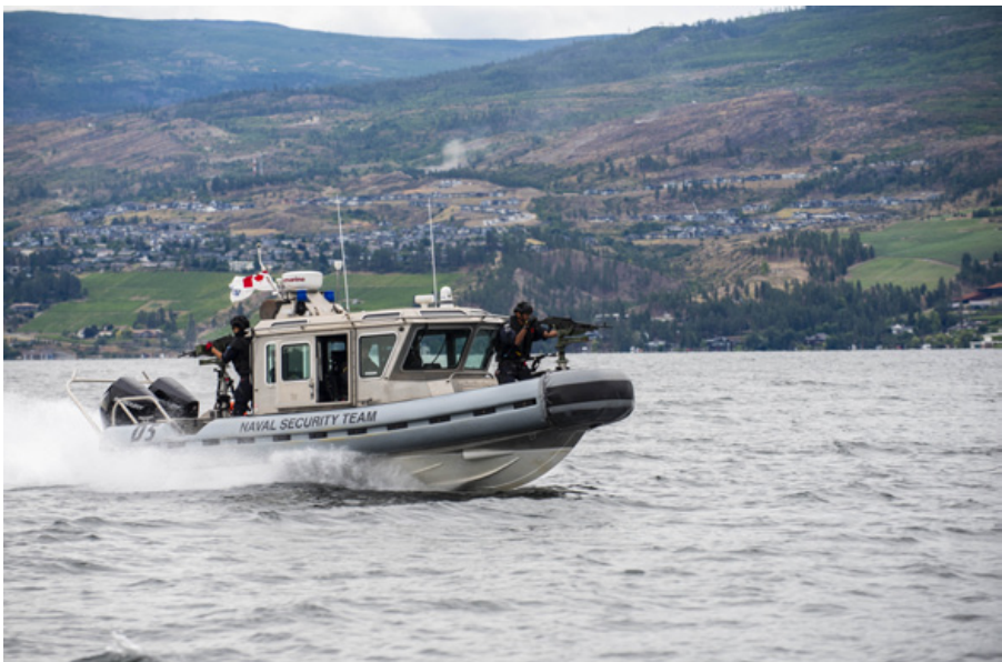
Des membres de l'équipe nationale de sécurité s'entraînent avec des embarcations de sécurité navale Defender sur le lac Okanagan, près de Kelowna (C.-B.), le 25 juillet.