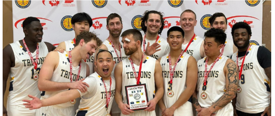
Les membres de l'équipe masculine de basket-ball des Tritons d'Esquimalt célèbrent leur victoire de 76 à 44 sur Cold Lake lors du match de championnat du championnat régional de basket-ball du Canada-Ouest, le 17 février à Moose Jaw, en Saskatchewan.