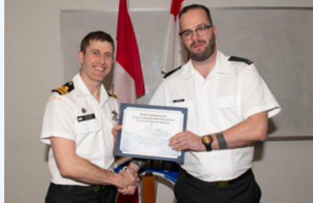
Marin de 3ème Lapiere reçoit le prix du meilleur étudiant