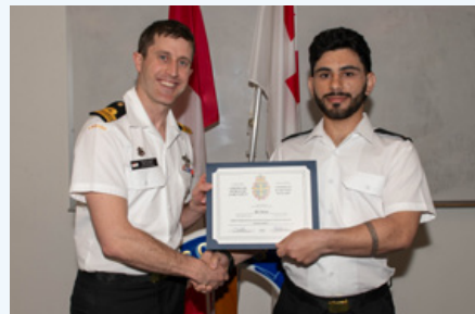
Marin de 3ème Daas