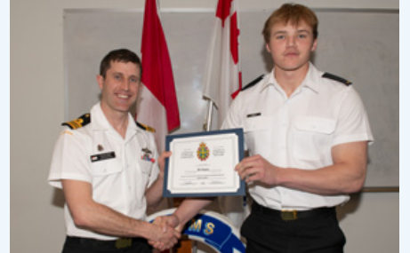
Marin de 3ème Coyne