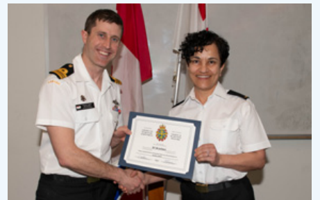
Marin de 3ème Hendekci