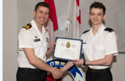
Marin de 3ème Esworth