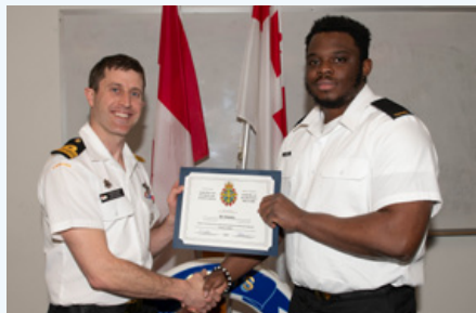
Marin de 3ème Osiebe