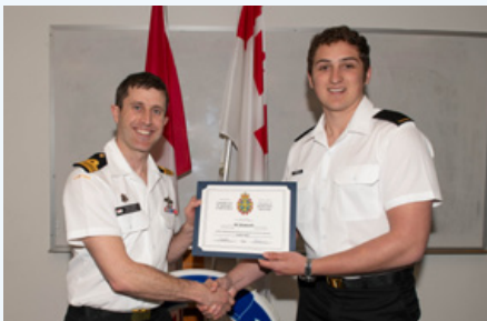
Marin de 3ème Hammett