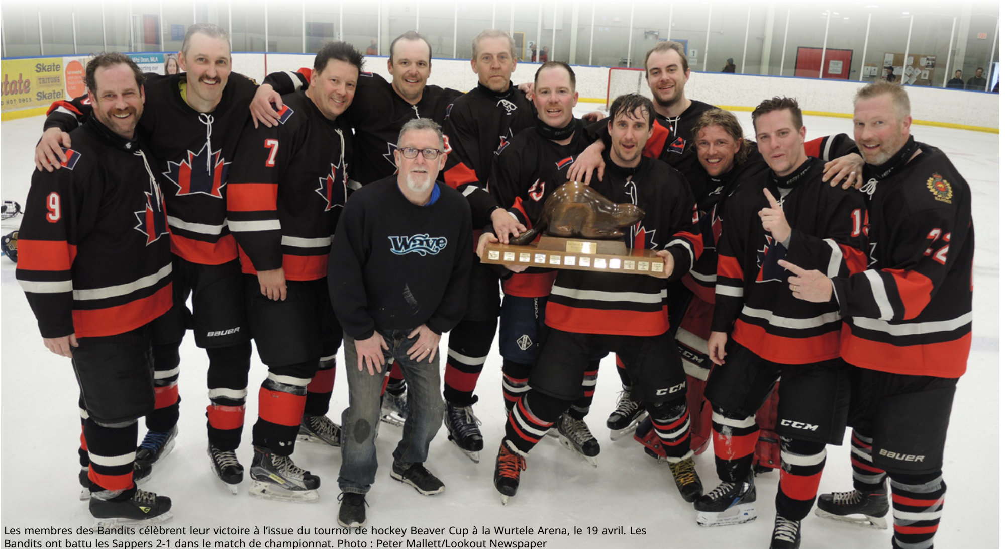
Les membres des Bandits célèbrent leur victoire à l'issue du tournoi de hockey Beaver Cup à la Wurtele Arena, le 19 avril. Les Bandits ont battu les Sappers 2-1 dans le match de championnat.

“C'est formidable d'être champion après une longue période de hockey et six matchs en trois jours, mais nous devons tirer notre chapeau à nos adversaires, les Sappers, qui se sont bien battus”, a déclaré Semeschuk.