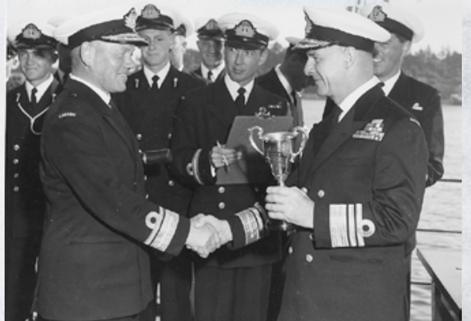
Le contre-amiral Hugh F. Pullen (à gauche) serre la main du vice-amiral Harry DeWolf.

Un héritage d'excellence navale et de philanthropie