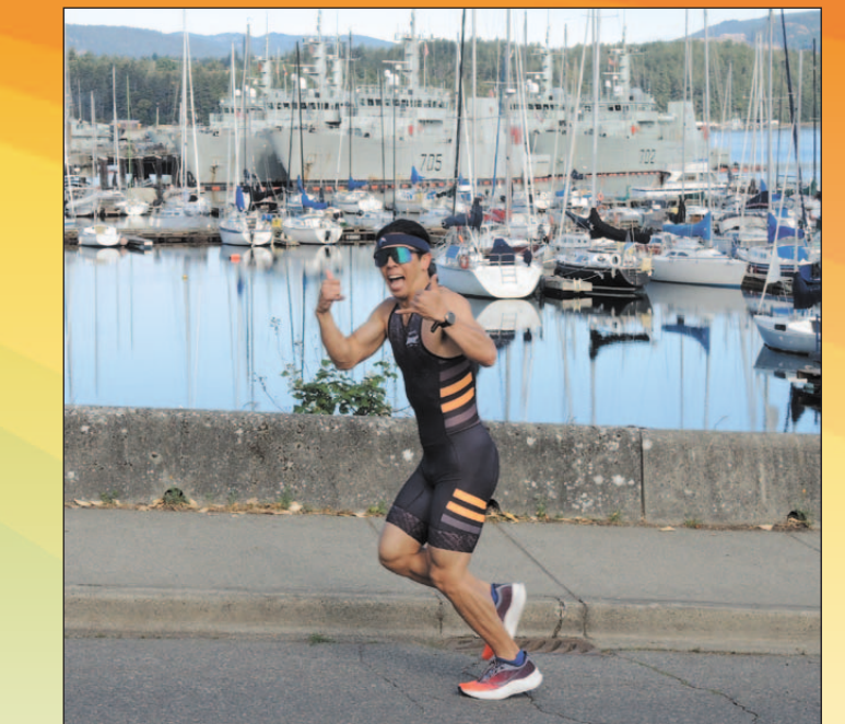
Un coureur fait le signe du pouce levé.

Événement social du Réseau de la fierté du service public Mardi 9 juillet 16h30 - 19h30 Brasserie de l'île de Vancouver Tous les 2ELGBTQ+ de la fonction publique, Les alliés et les amis sont les bienvenus ! Contactez colin.lussier@forces.gc.ca pour plus d'informations.