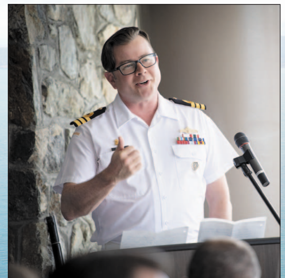
Le capitaine de frégate Sam Patchell, nouveau commandant adjoint de la Flotte canadienne du Pacifique.