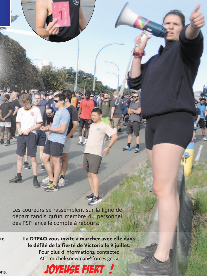
Les coureurs se rassemblent sur la ligne de départ tandis qu'un membre du personnel des PSP lance le compte à rebours.

La DTPAO vous invite à marcher avec elle dans le défilé de la fierté de Victoria le 9 juillet. Pour plus d'informations, contactez AC : michele.newman@forces.gc.ca JOYEUSE FIERTÉ !