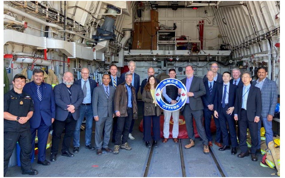
La délégation de l'OTAN, composée de membres du Groupe de capacité de conception de navires de l'OTAN, a visité la passerelle du NCSM Ottawa avant de se rendre dans la salle des machines.

La visite de la délégation de l'OTAN a mis en évidence l'importance stratégique de la IMFCB, ses capacités techniques et les compétences exceptionnelles de son personnel. En outre, elle a permis de rappeler le rôle essentiel que joue la IMFCB dans le soutien de la flotte et dans la réalisation des objectifs de défense nationaux et internationaux.