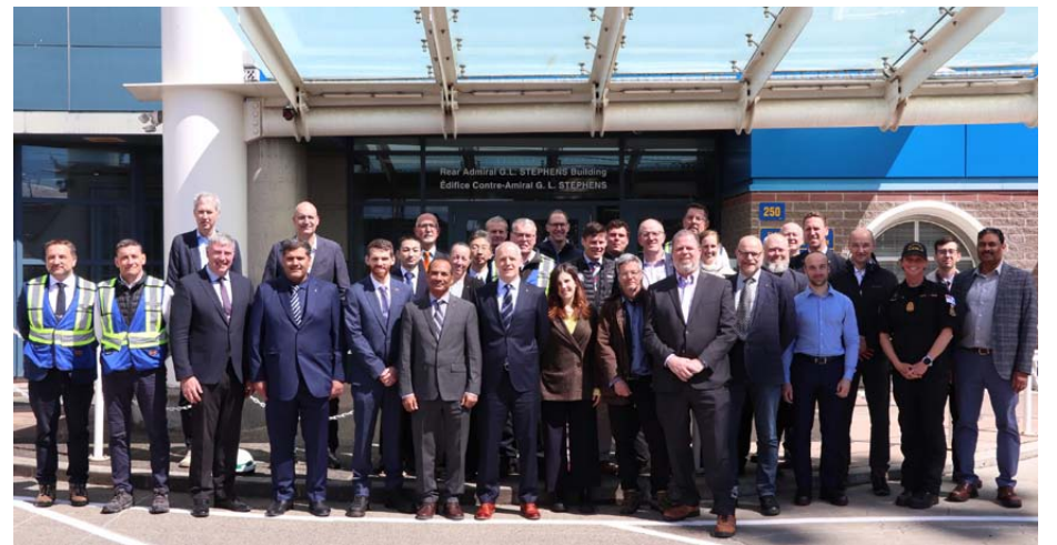
Des architectes navals, des ingénieurs maritimes et électriques et des scientifiques de 15 pays ont visité l'Installation de maintenance de la Flotte Cape Breton les 28 et 29 mai.

Now Renting 1 & 2 Bedroom Apartments. Move-in Ready.