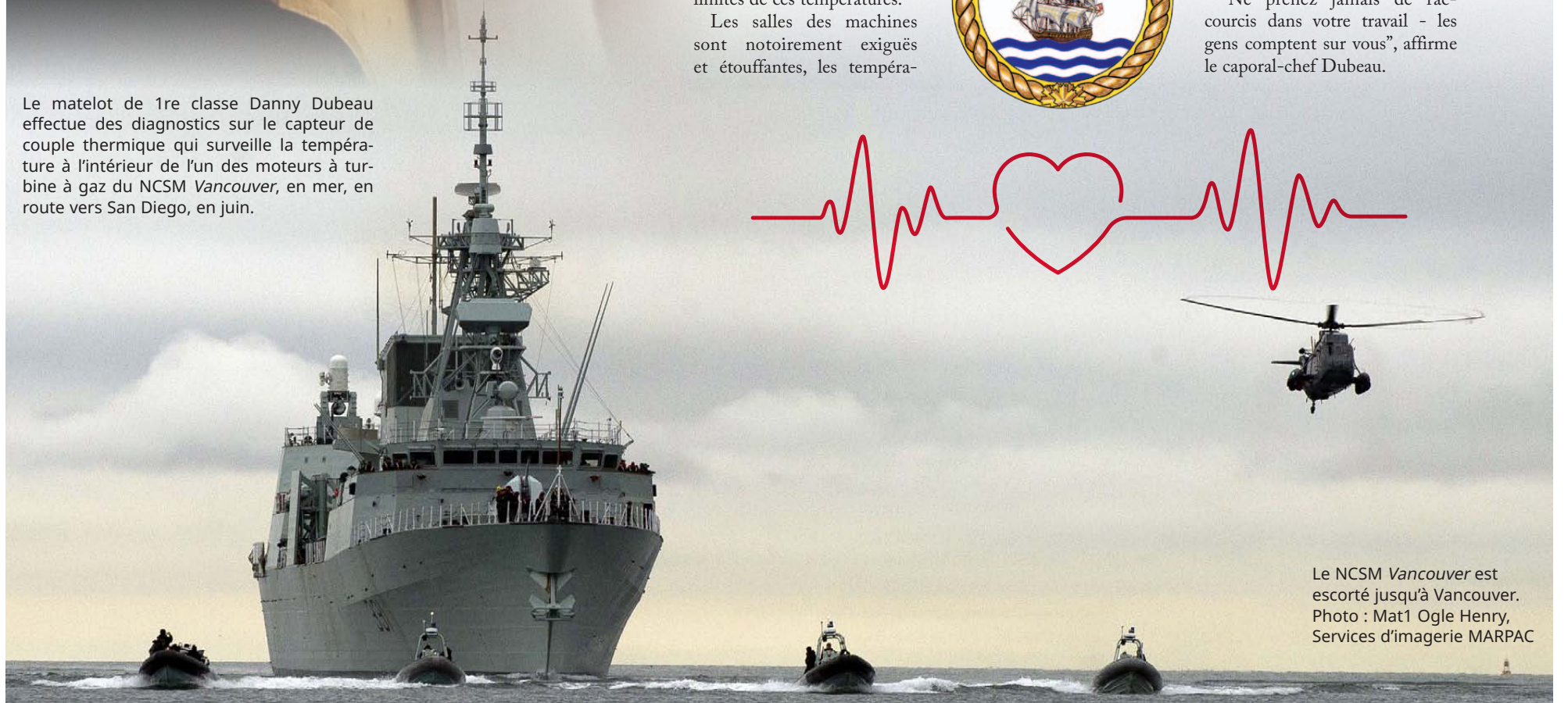
Le NCSM Vancouver est escorté jusqu’à Vancouver.

Le matelot de 1re classe Danny Dubeau effectue des diagnostics sur le capteur de couple thermique qui surveille la température à l’intérieur de l’un des moteurs à turbine à gaz du NCSM Vancouver , en mer, en route vers San Diego, en juin.