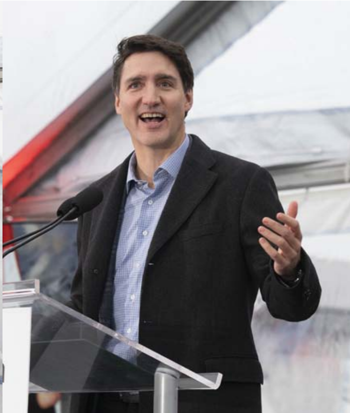
Le très honorable Justin Trudeau, premier ministre du Canada.