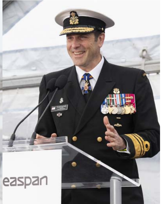
Le Vice-amiral Angus Topshee, Capitaine de frégate de la Marine royale canadienne.