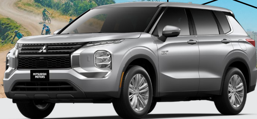
2025 OUTLANDER PHEV ES S-AWC