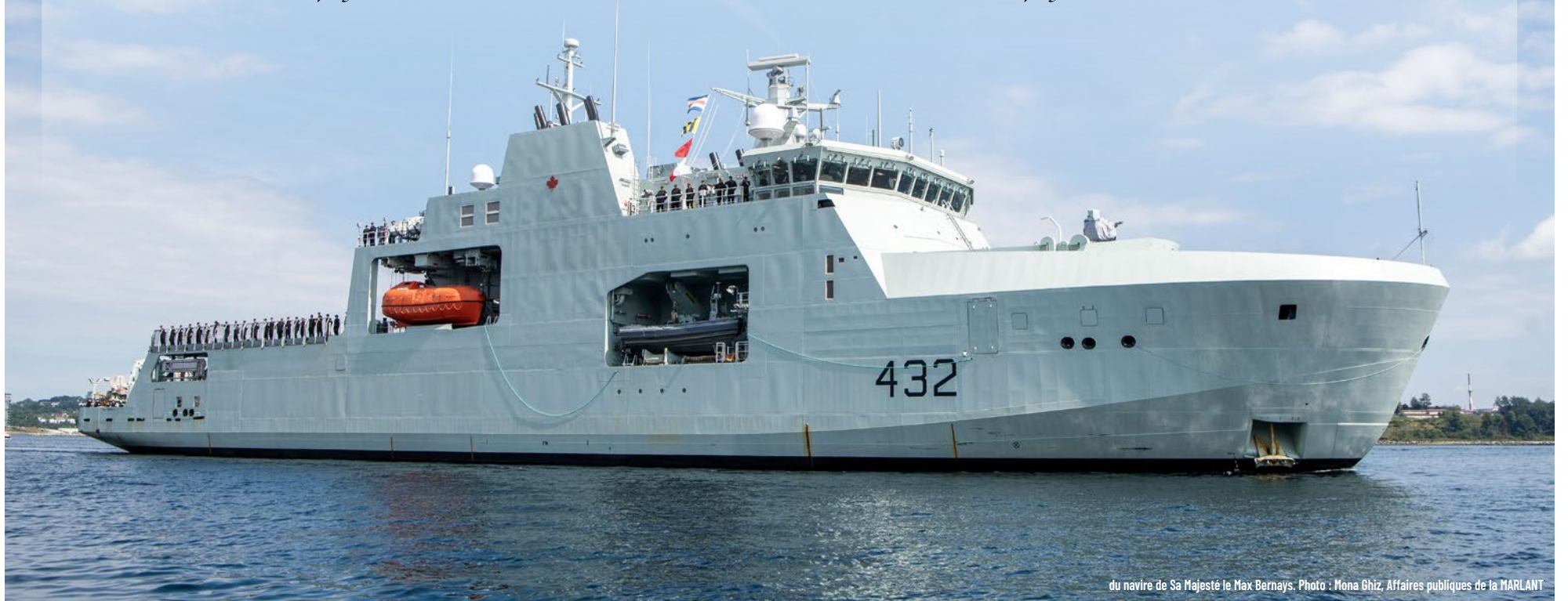
du navire de Sa Majesté le Max Bernays.

Un accueil chaleureux à la nouvelle équipe de commandement