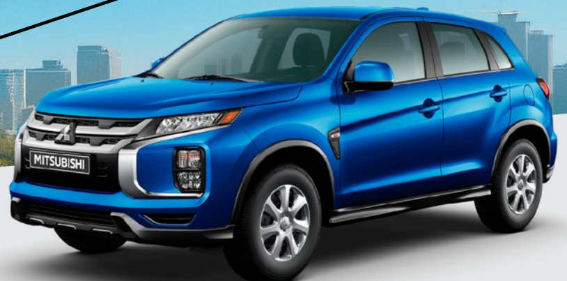
2026 RVR ES FWD

LEASE A 2025 OUTLANDER PHEV ES S-AWC FOR