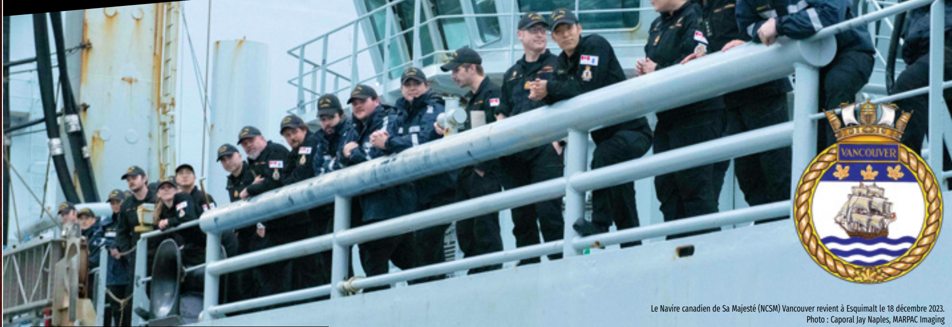
Le Navire canadien de Sa Majesté (NCSM) Vancouver revient à Esquimalt le 18 décembre 2023.