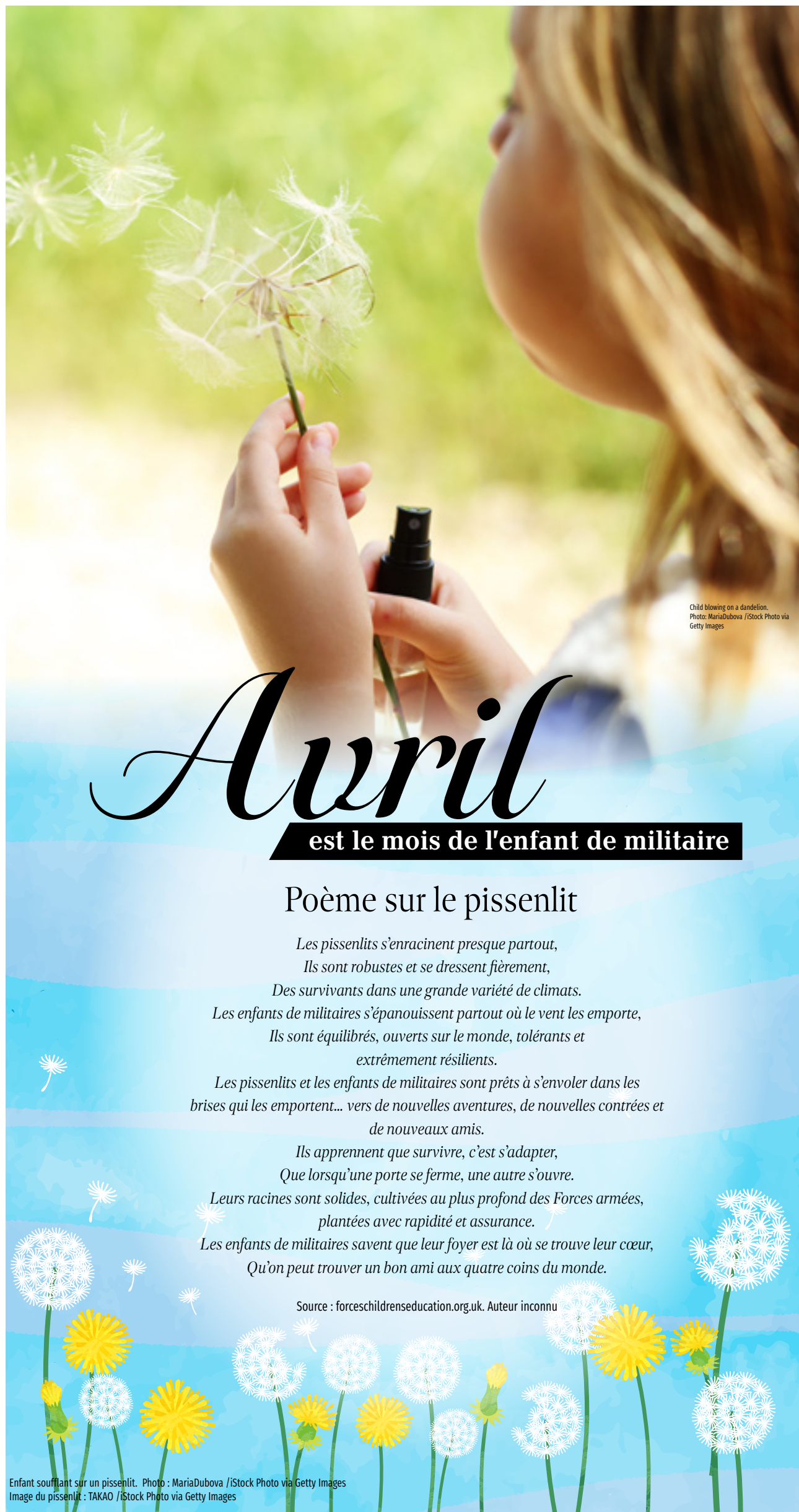
Child blowing on a dandelion.