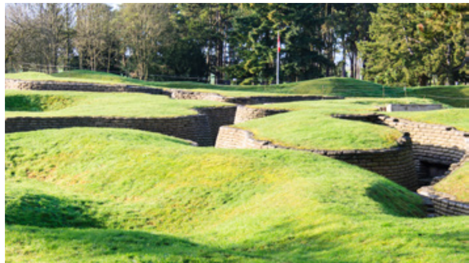
Les tranchées et les cratères sur le champ de bataille de la crête de Vimy.