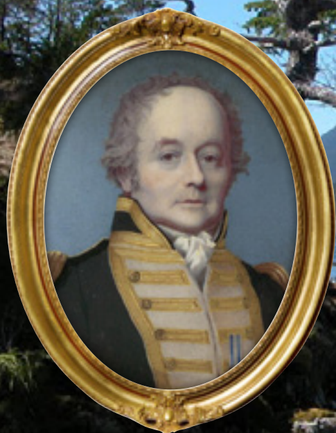
Resolution Cove, vue depuis l'île Bligh, en Colombie-Britannique. Encadré : Portrait du vice-amiral William Bligh réalisé par Alexander Huey en 1814.