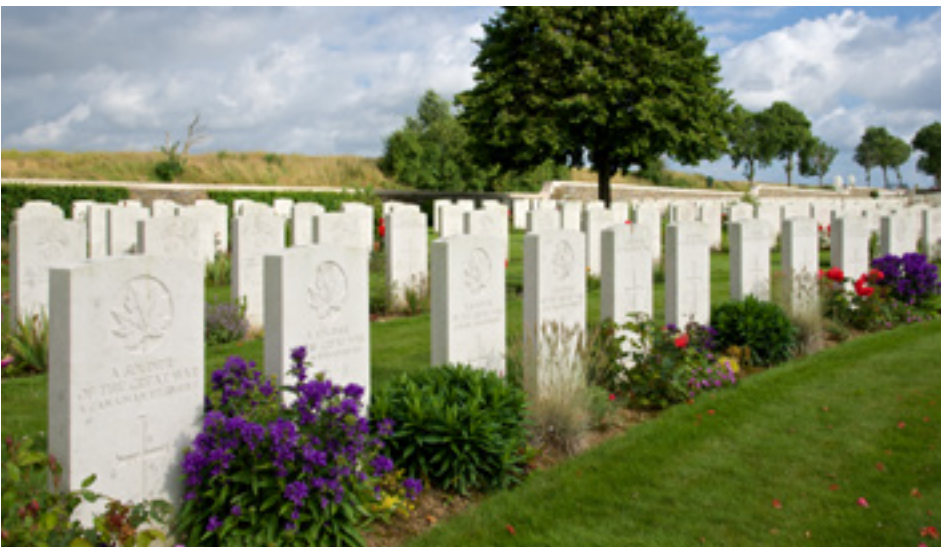
Sépultures de guerre au cimetière militaire de Cabaret Rouge, près de la crête de Vimy.