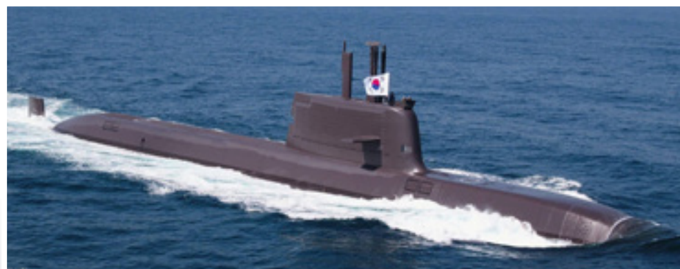
Encadré : Le ROKS Dosan Ahn Chang-ho en mer, effectuant sa première traversée du Pacifique vers les côtes canadiennes.

Alors que les défis maritimes mondiaux continuent d'évoluer, des engagements tels que la prochaine visite de la ROKN soulignent l'importance de partenariats internationaux solides. Grâce à des exercices conjoints, des échanges de personnel et une collaboration soutenue, la RCN continue de renforcer l'interopérabilité et la confiance nécessaires pour opérer efficacement, ensemble, en mer.