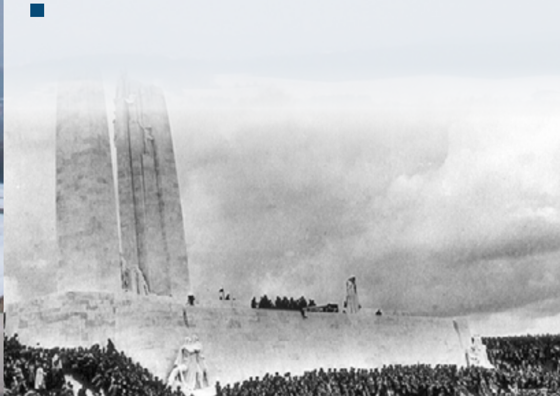
Image d'arrière-plan : Une statue au Mémorial de la crête de Vimy. | Encart : Inauguration du Mémorial national canadien de Vimy en 1936.

Bataille de la crête de Vimy | Anciens Combattants Canada