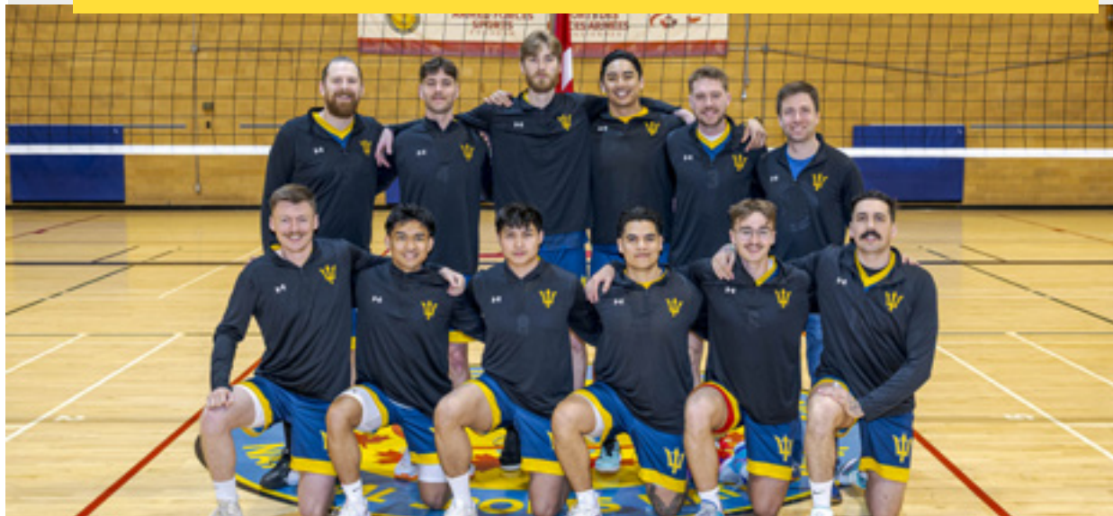
L'équipe de volleyball des Tritons de la BFC Esquimalt pose pour une photo lors du Championnat national de volleyball masculin des FAC qui s'est tenu en avril.