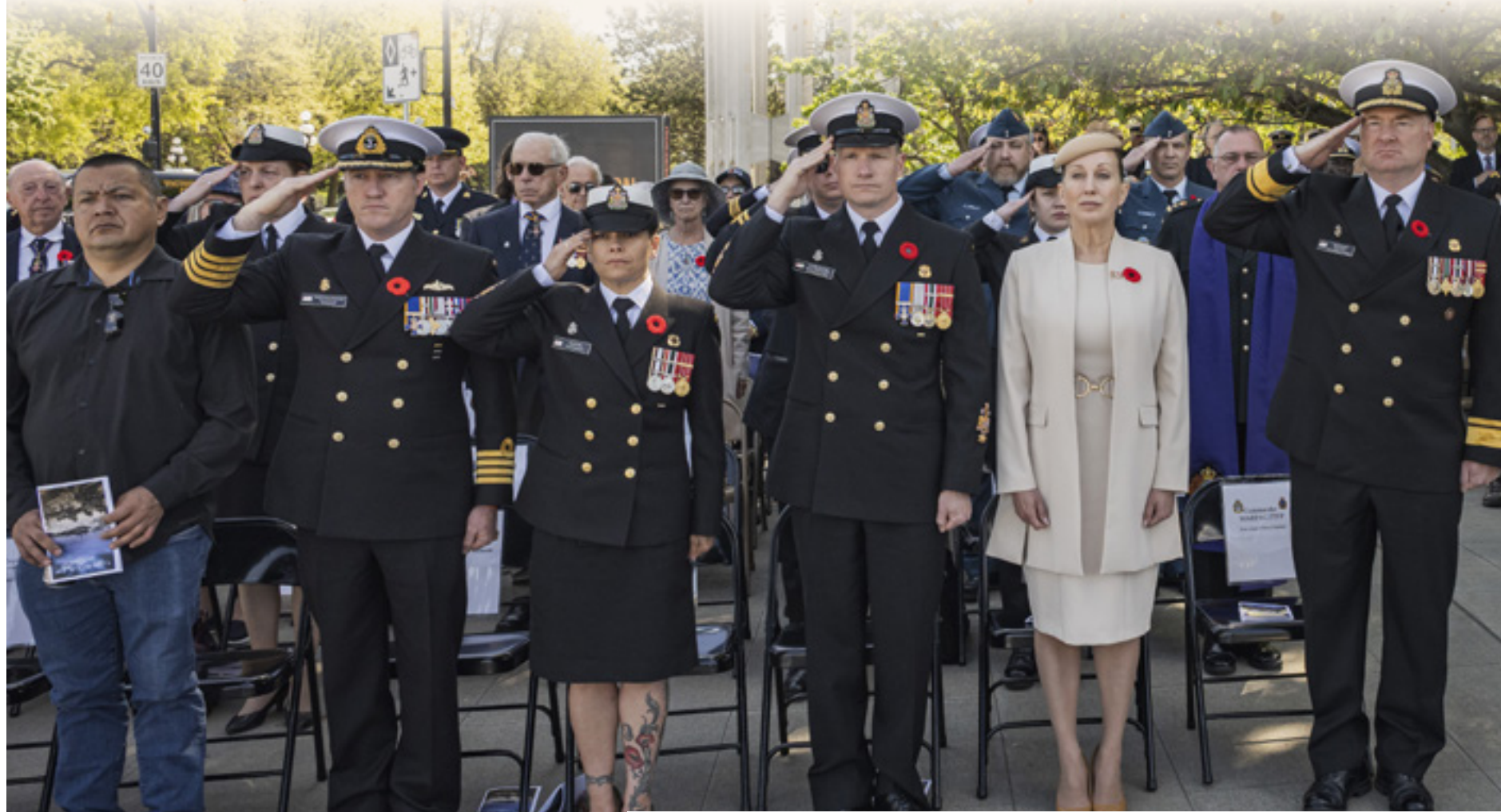
Des membres de la communauté de la Défense se lèvent lors de la cérémonie annuelle de la bataille de l'Atlantique qui s'est tenue le 3 mai à Victoria.

Alors que les couronnes étaient déposées et que la cérémonie touchait à sa fin, la fanfare a continué son chemin sur la rue Government sous les acclamations de la foule. Le message restait clair : nous rendons hommage au passé et à tous ceux qui se sont sacrifiés et continuent de se sacrifier — pour nous.