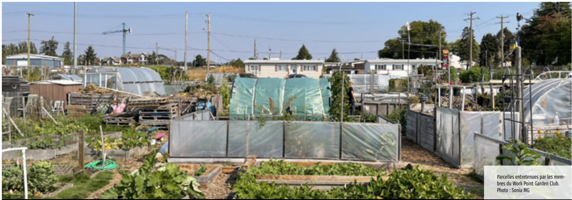
Parcelles entretenues par les membres du Work Point Garden Club.